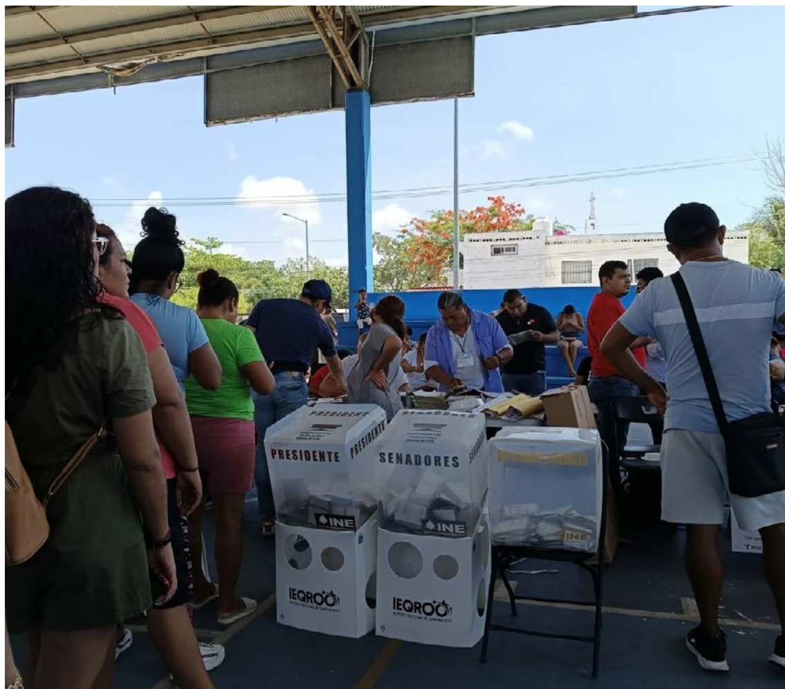
Votos en Actas Contabilizadas

Asimismo, el día 9 de junio se realizarán los cómputos municipales para la declaración de validez y entrega de constancias de mayoría a las candidaturas ganadoras a las 11 presidencias de esta jornada electoral. El mismo día 9 de junio también